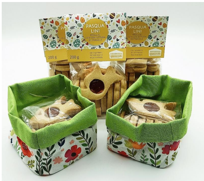
Biscotti Pasqualini Prodotti e confezionati da Dolci Sogni Liberi nel Carcere di Bergamo