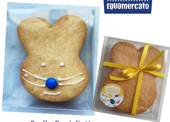
Frolla Coniglietto Prodotta e confezionata da Fattoria Casanova di San Miniato