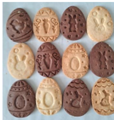
Biscotti pasquali vegani cacao e vaniglia Prodotti e confezionati da La Merenda della Fragola di Olgiate Molgora